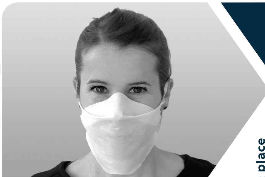
Coloris variable, photo non contractuelle

Masque réservé à des usages non sanitaires de catégorie 1 selon la note d'information du 29 mars 2020